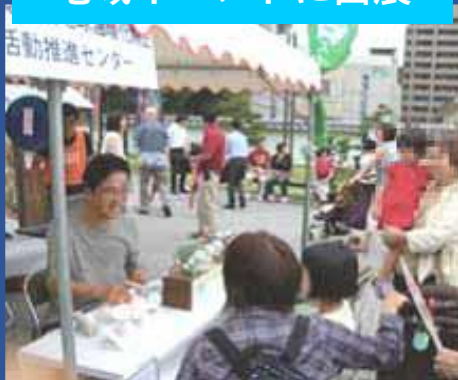
地域イベントに出展