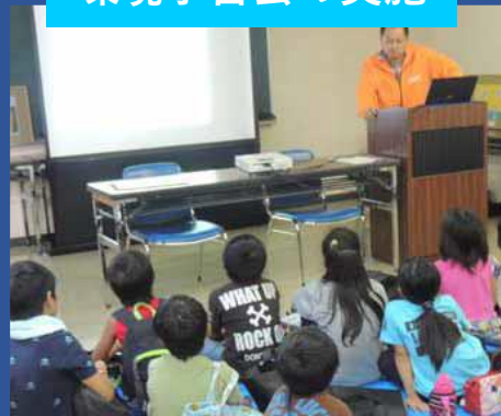
環境学習会の実施